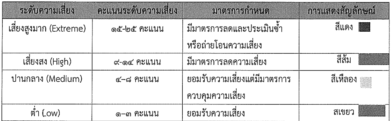
ตารางระดับของความเสี่ยง (Degree of Risk)

ซึ่งจัดแบ่งเป็น ๔ ระดับ สามารถแสดงเป็น Risk Profile แบ่งพื้นที่เป็น ๔ ส่วน (๔ Quadrant) ใช้เกณฑ์ในการจัดแบ่งดังนี้